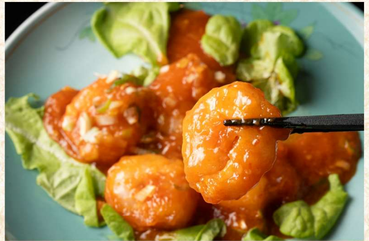
海老チリソース煮