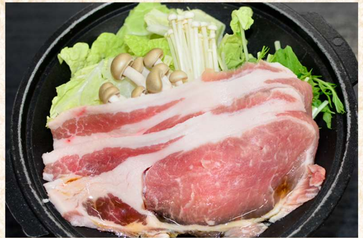
越後米豚「越王」 すき焼き